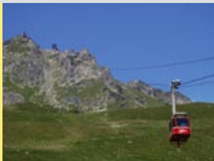
Mit der Luftseilbahn gehts über die Mittelstation Fiescheralp zum Eggishorn.

Luftseilbanen Fiesch-Eggishorn AG, 3984 Fiesch Tel. 027 971 27 00 www.eggishorn.ch