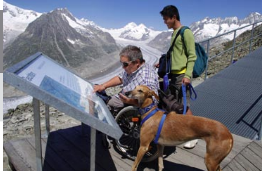
Die meisten Panoramatafeln mit Erklärungen zu den Gipfeln wurden auf einer Höhe, die gut für Rollifahrer einsehbar ist, angebracht.