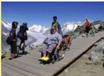
Oben und unten: Auf dem Gipfel rollen wir über einen Holzsteg zum Bergrestaurant.