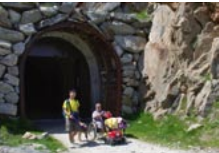
15 Minuten lang dauert der Weg durch den dunklen Tälligattunnel. Taschenlampe und Jacke mitnehmen!

Zurück bei der Mittelstation Fiescheralp entscheiden sich die Sportlichen und Unternehmungslustigen unter uns zu einer Wanderung zum Märjelensee. Hierzu folgen wir dem Wegweiser nach Nordosten. Wir merken rasch was Sache ist, denn der Weg ist holprig und steinig. Zunächst gehts bergab (max. Neigung 17% über 30 m), teils mit Querneigungen (7 % über 20 m) bis zum Punkt 2180. Wir geniessen dabei das Panorama hinunter ins Rhonetal. Bei der zweiten Verzweigung nehmen wir den oberen Weg. Dieser wird gleich ordentlich steil (Steigung 18 % über 70 m, teilweise bis zu 23 %). Haben wir dies geschafft, wird auch der Rest kein Problem mehr sein. Vielleicht müssen wir mit dem Swiss-Trac auch rückwärts bergauf. Es geht nun kontinuierlich über eine Strecke von rund einem Kilometer aufwärts. Nach der Alp Salzgäb erklimmen wir über eine S-Kurve eine kleine Anhöhe danach fällt der Weg wieder leicht hinunter zum Tunnelportal ab. Der Weg im Tunnel wird teilweise bis zu 80 cm schmal und hat Querneigungen, da der Boden uneben ist. Ständig müssen wir Wasserpfützen ausweichen. Nachdem wir wieder am Tageslicht sind, sehen wir den Märjelensee. Bis zur Gletscherstufe gehts nochmals über einen Holperweg (Steigung 12 % über 300 m), das letzte Stück führt über grobe Steine, wo auch Hilfe notwendig ist. Schliesslich müssen wir den ganzen Weg wieder zurück zum Ausgangspunkt