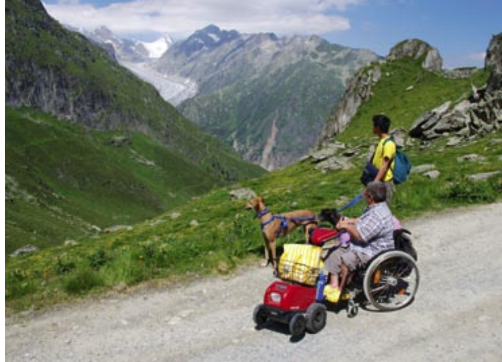
Oben: Im Oberen Tälli blicken wir zum Fieschergletscher hinüber.