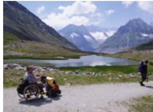
Unten: Bilderbogen unserer Tour – ein Erlebnis, von dem wir noch lange erzählen.