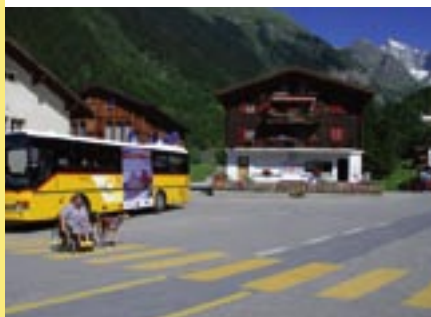
Oben: In Fieschertal erkunden wir den Ort. Unten: Das Wysswasser – ein Gletscherbach.