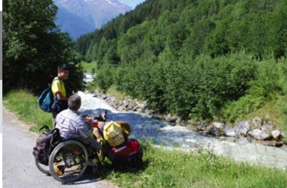
Heute hat das Wysswasser dank seinen Verbauungen und dem Stausee oben am Gletscher weitgehend seinen Schrecken verloren.