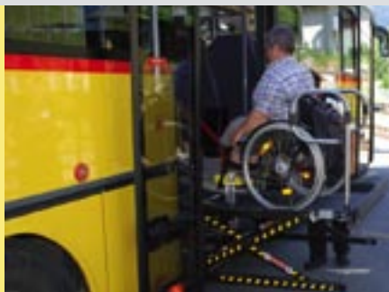
Drei von vier Postautos haben in Fiesch schon einen elektrischen Lift für Rollifahrer.

Eggishorn Tourismus 3984 Fiesch Tel. 027 970 60 70 www.fiesch.ch