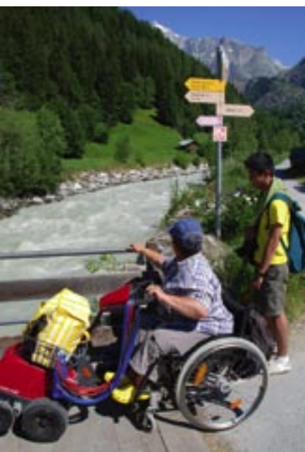
Der Weg entlang dem schäumenden Wysswasser ist gut signalisiert.

Wer in den Bergen wohnt, lernt mit den Naturgefahren zu leben. Im Fieschertal brachte das Wysswasser in früheren Zeiten jedoch immer wieder grosses Unheil über die Talbewohner. Regelmässig staute sich der Märjelenensee hoch oben beim Gletscher im Frühjahr. Grosse Eisblöcke versperrten den Abfluss. Und als diese Sperre dann plötzlich brach, ergoss sich eine Flutwelle ins Tal. Aus diesem Grund wurde im letzten Jahrhundert der Staudamm oben am Märjelensee erbaut. Seither fühlen sich die Talbewohner nicht mehr ständig bedroht. Ausserdem wurde das Ufer des Wysswassers zum Schutz vor Hochwasser mit grossen Steinblöcken verbaut und das Kieswerk schaufelt regelmässig das Geschiebe aus dem Bach und verwertet es zu Beton für die Bauindustrie. Dank diesen Massnahmen ist die Lebensqualität im Fieschertal gestiegen, so dass der Ort heute auch vom Tourismus der Region profitieren kann.